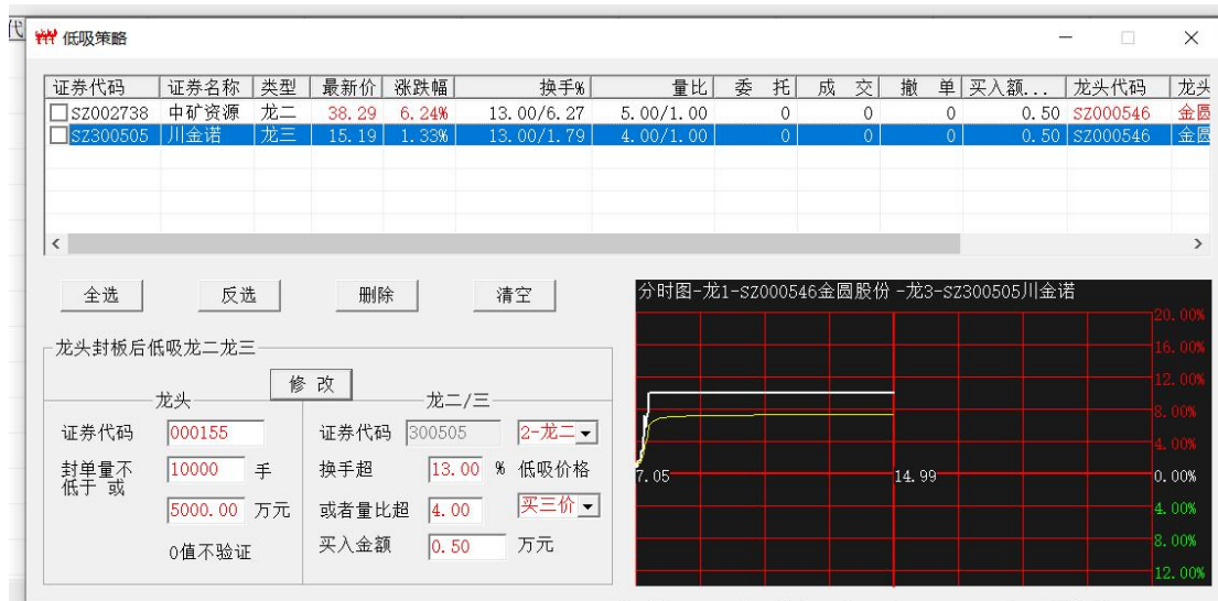
图 8 拟修改策略参数