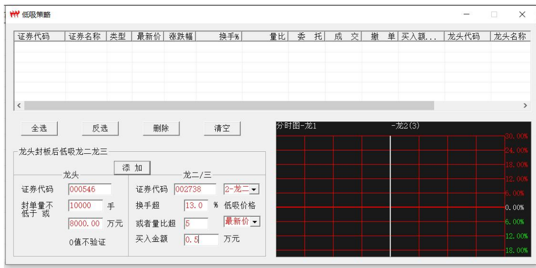
图 4 拟添加的龙二策略