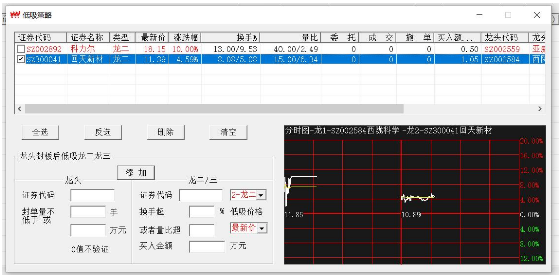
图 12 勾选中策略后点 删除或清空 按钮 可以删除选中的策略

09:25:00, 600667竞价-1[202884, 15000][7. 900, 7. 260][0. 088][0. 075, 0. 100] 09:25:00, 600667连板不符 20231120 09:29:04, 查L1行情快照[5079] 20231120 09:29:36, 处理[加载并核对]历史数据完成[成功5079][5079, 0]! 20231120 09:30:07, 启动低吸策略! 20231120 09:30:34, 添加低吸策略代码[SZ002559, SZ002892][龙二] 20231120 09:30:34, 添加低吸策略-代码[SZ002892][50000, 15000. 00][13. 00, 40. 00][0. 50, 0]成功! 20231120 09:30:34, 002559订阅L2行情成功! 20231120 09:30:34, 002892订阅L2行情成功! 20231120 09:30:34, SZ002892低吸策略[SZ002559涨停]满足量比条件[75. 496>40. 000] 20231120 09:30:34, 低吸策略-代码[SZ002892]下单执行价格[0, 17. 51] 20231120 09:30:34, SZ002892低吸-计算买入数量[YMSL = 200][0. 50/17. 51] 20231120 09:30:34, 002892_102892[360, VIP: 资金不足] 20231120 09:30:35, [StopWord]TimeLineBack[ 002559, SZ0 20231120 09:33:04, 603052_93303670[360, VIP: 资金不足] 20231120 10:00:52, 添加低吸策略代码[SZ002584, SZ300041][龙二] 20231120 10:00:52, 添加低吸策略-代码[SZ300041][10000, 0. 00][8. 08, 15. 00][1. 05, 0]成功! 20231120 10:00:52, 002584订阅L2行情成功! 20231120 10:00:52, 300041订阅L2行情成功!