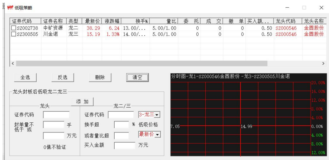
图 9 清空修改后继续添加