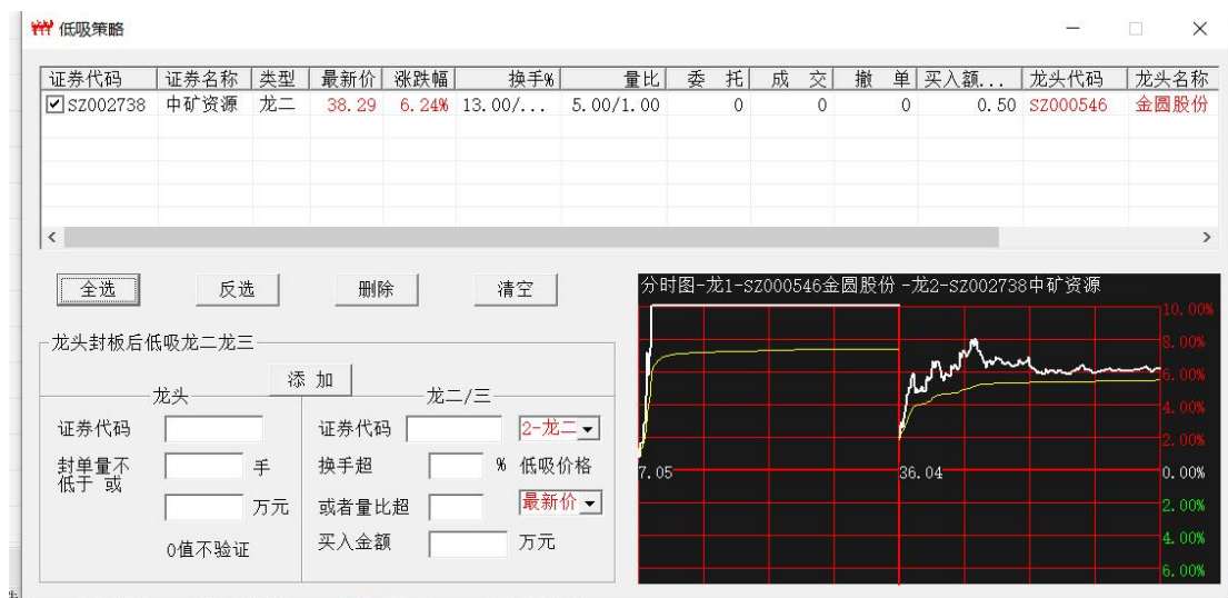
图 5 添加策略