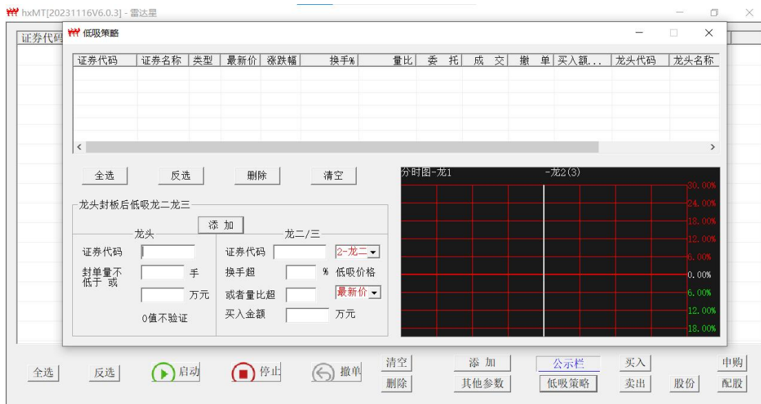
图 3 策略空白状态