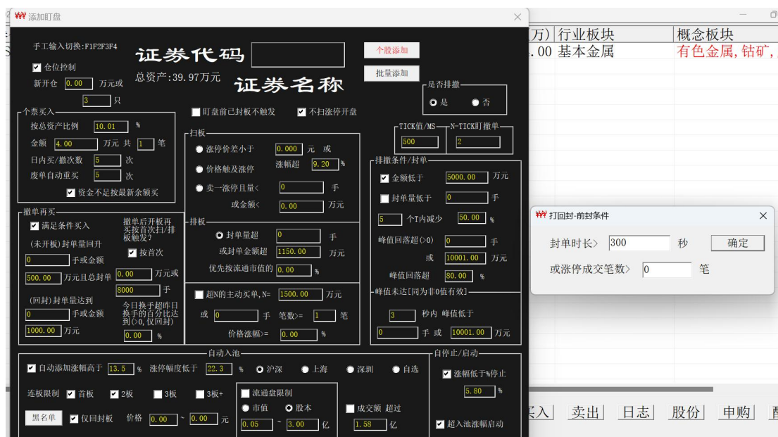
图 5 自动入池，打回封，设置前封最少时长 300 秒

切记：自动入池打回封入池时间点，要等待开板后才能入池，且要满足开板前的封板时长不低于设置值，比如 300 秒。举例中的 300663 打回封入池是要等到下午开板才能入池。等同于人工在开板后再添加盯盘。至于是扫板或排板都没有关系。