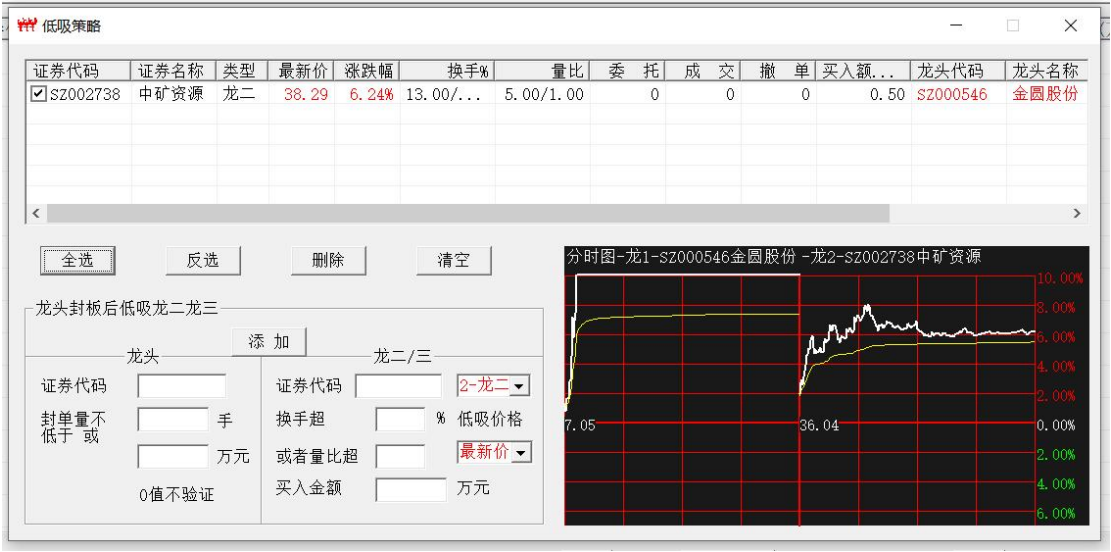
图 1 策略总览

处理历史 K 线数据，下图中点‘是’。等待数据处理…完成后‘低吸策略’按钮才可以使用。