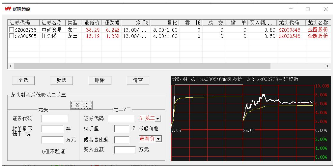
图 7 龙头 000546 龙二 002738 龙三 300505