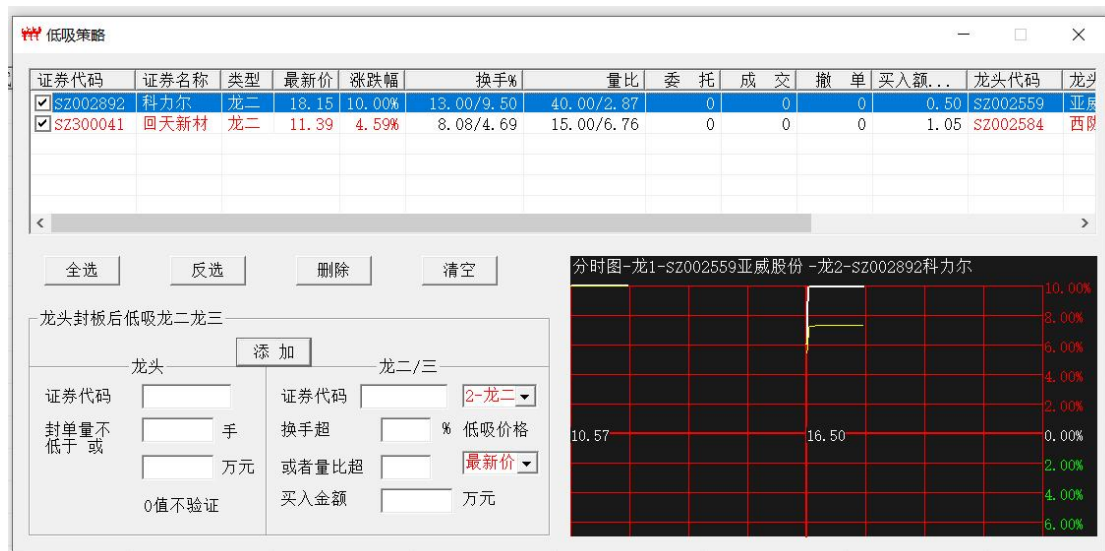
图 10 策略一结果图